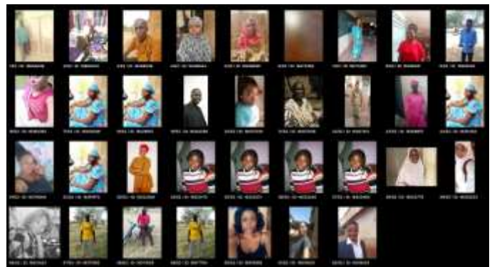
Photos de quelques jeunes qui ont répondu à VOICE -WA

Un autre jeune garçon disait « Je souhaite être un leader pour défendre le problème des jeunes, je voudrais voir dans notre société que tous les jeunes sont bien éduqués et bien écoutés. Avoir une assemblée parallèle des jeunes dans laquelle tous les problèmes des jeunes sont pris en compte. Seuls les jeunes comprennent le problème de jeunes, donc la formation des jeunes doit être faite par des jeunes ».