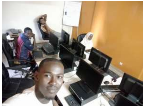
Jeunes de l'association Youth tea en pleine conception de projet